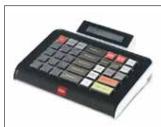
Tastiera 40 tasti + Display