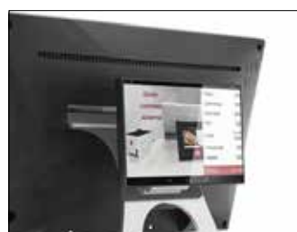
Display 7" lato cliente